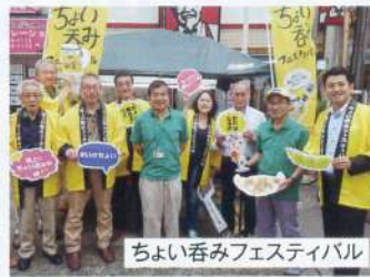
ちよい呑みフェスティバル